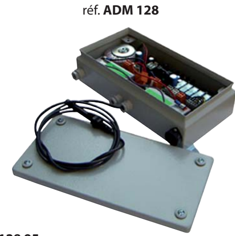
réf. ADM 128